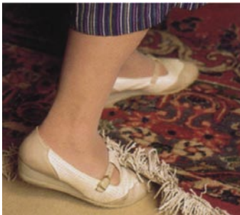
HEWI Heinrich Wilke GmbH

Stolperfallen wie Läuferteppiche und freiliegende Kabel sind möglichst zu beseitigen.