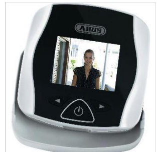
ABUS August Bremicker Söhne KG

Schalter und Steckdosen sind auf einer Höhe von 85 cm bis max. 1,05 m sinnvoll. Rollläden und Markisen sollten möglichst elektrisch bedienbar sein.